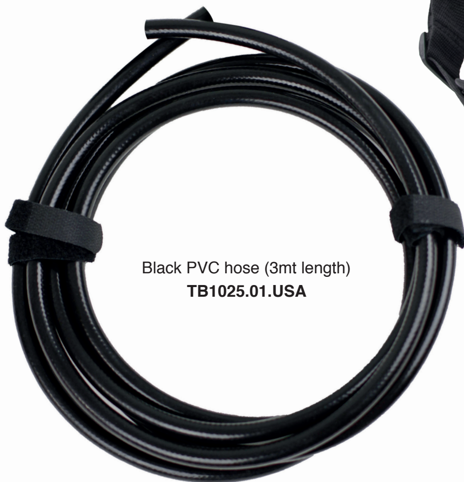
Black PVC hose (3mt length) TB1025.01.USA