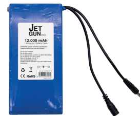
12.000 mAh Lithium-Ion battery