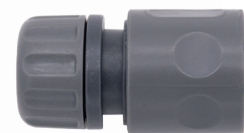
Raccord rapide femelle en plastique pour tube noir RV6037.01.USA