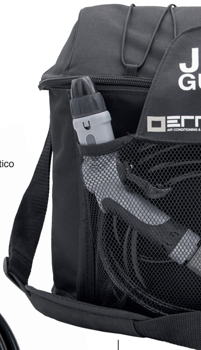
Bandolera de repuesto RPL001.01.USA