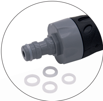
Jointes en plastique à raccord rapide pour pistolet de distribution RG9014.05.USA