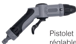
Pistolet avec jet réglable