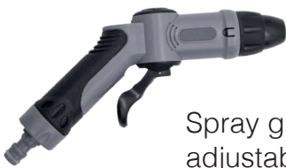
Spray gun with adjustable spray