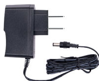
Cargador de batería para la batería de iones de litio adicional