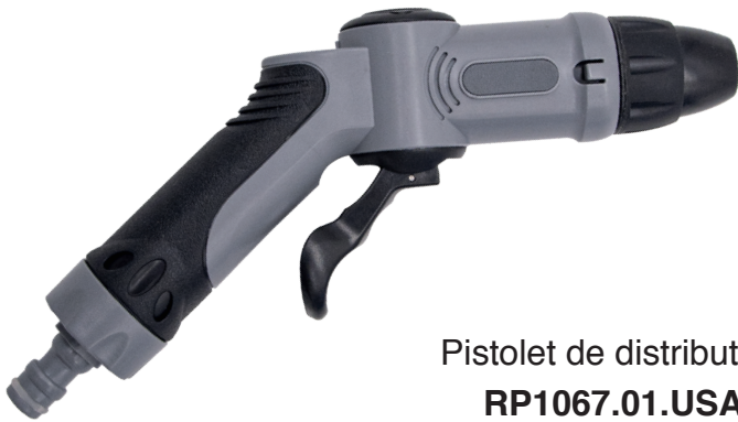
Pistolet de distribution RP1067.01.USA