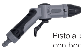
Pistola pulverizadora con boquilla ajustabl