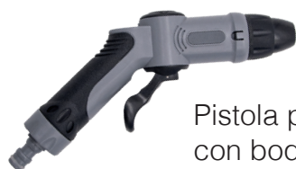
Pistola pulverizadora con boquilla ajustable