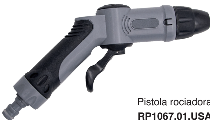
Pistola rociadora RP1067.01.USA