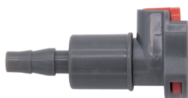
Enchufe hembra de plástico para la conexión de las bolsas RV6039.01.USA