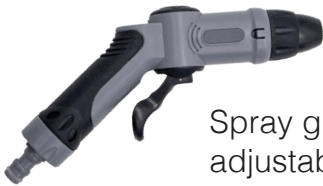
Spray gun with adjustable spray