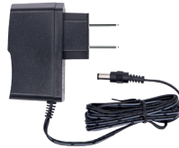
Battery charger 110 - 220 V with USA plug