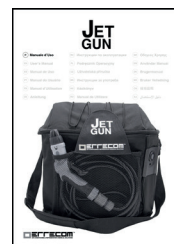
Manual de instrucciones