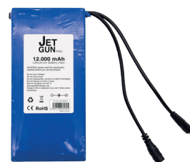
Batería de iones de litio de 12,000 mAh