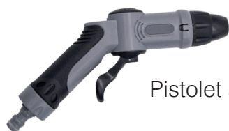
Pistolet avec jet réglable