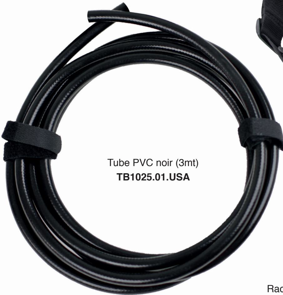
Tube PVC noir (3mt) TB1025.01.USA