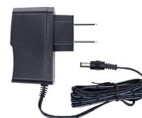
Chargeur de batterie VRLA