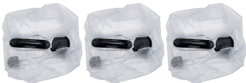
3 bolsas intercambiables de 2.38US Gal (9 litros)

Antes de usar JetGun PRO , asegúrese de que todos los componentes enumerados a continuación estén incluidos en el paquete. Si falta algún componente, comuníquese con el distribuidor donde compró JetGun PRO .