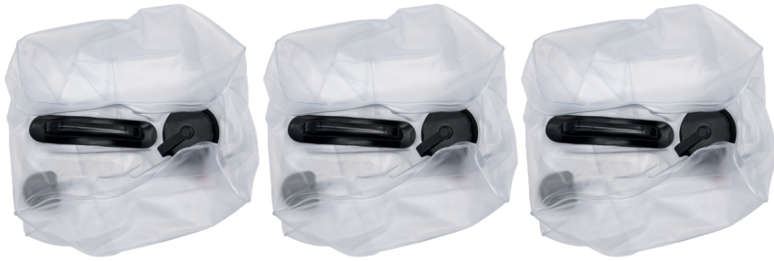
no.3 interchangeable 2.38 US Gal (9 Liters) bags

Before starting, check that all the following items have been included with your JetGun . If anything is missing, contact your dealer.