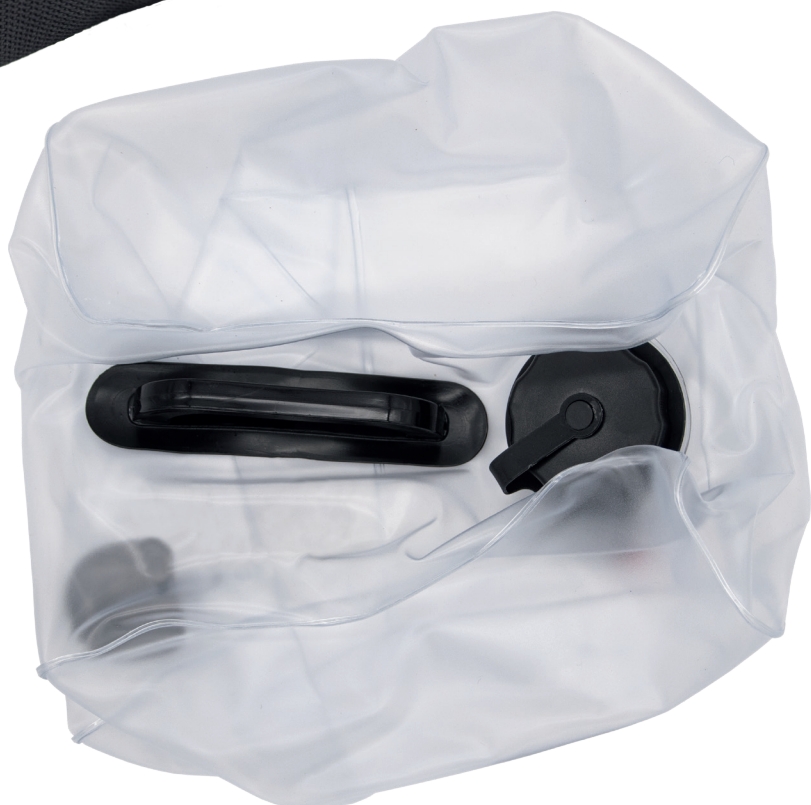
Sac en plastique FL1100.01.USA