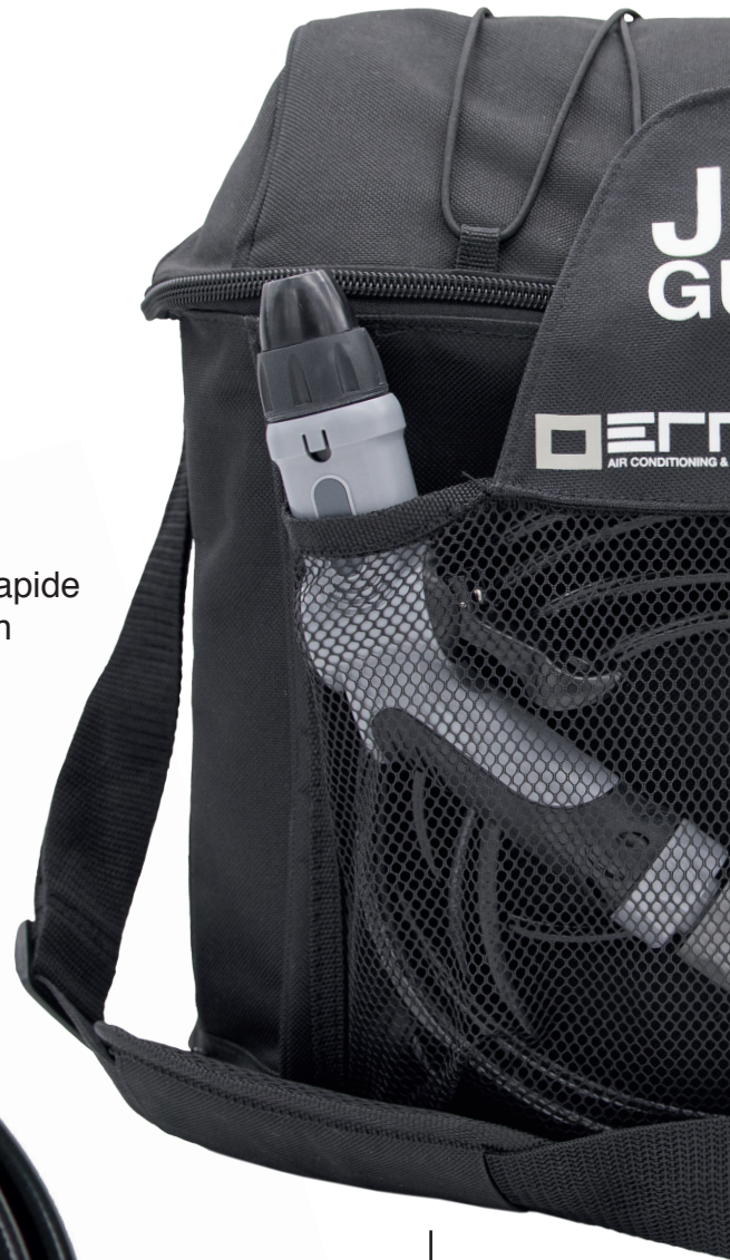
Bandoulière de rechange RPL001.01.USA