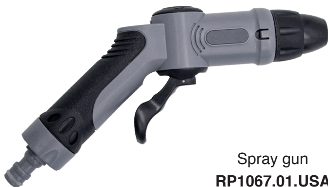
Spray gun RP1067.01.USA