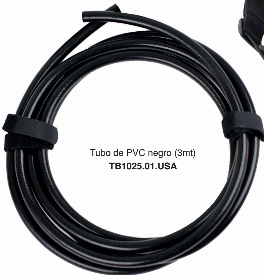
Tubo de PVC negro (3mt) TB1025.01.USA