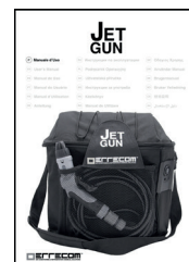
Manual de instrucciones