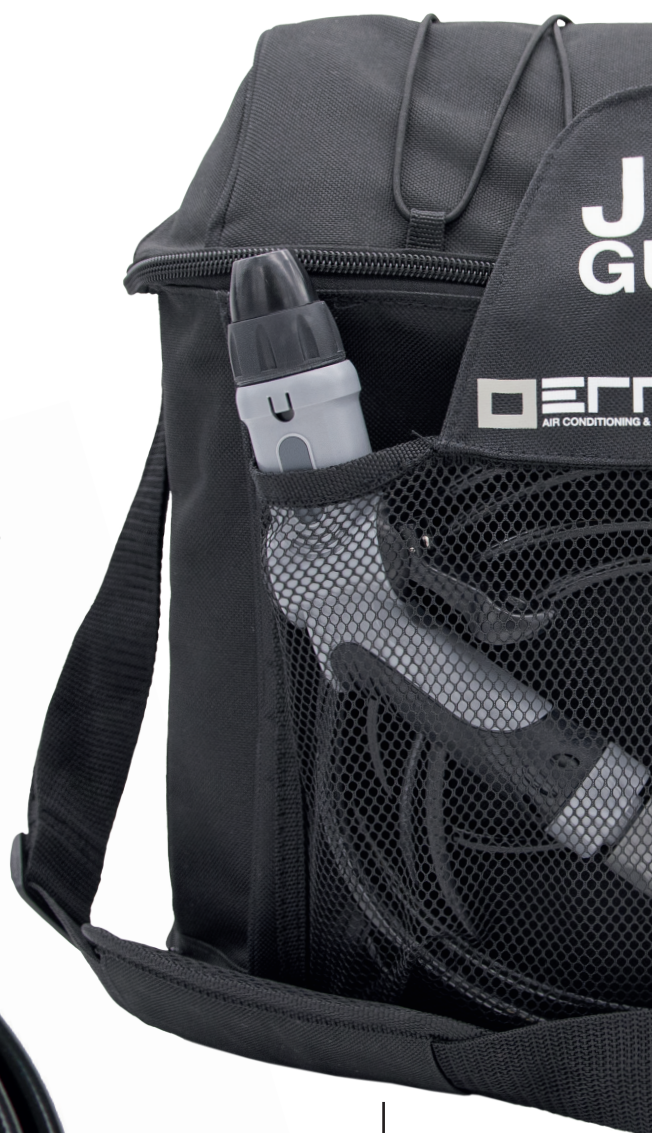
Shoulder strap RPL001.01.USA