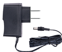
Chargeur de batterie 110 - 220 V avec prise USA